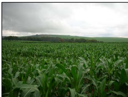
sub-unidade morfoescultural 2.4.5

A sub-unidade morfoescultural número 2.4.5, denominada Planalto do Alto-Médio Piquiri, situada no Terceiro Planalto Paranaense, apresenta dissecação média e uma área de 1.032,85 km², que corresponde a 6,26% desta Folha. A classe de declividade predominante é menor que 12% em uma área de 876,80 km². Em relação ao relevo, apresenta um gradiente de 260 metros com altitudes variando entre 280 (mínima) e 540 (máxima) m. s. n. m. As formas predominantes são topos alongados e isolados, vertentes convexas e convexo-côncavas e vales em “V”, modeladas em rochas da Formação Serra Geral do Período Jurássico.