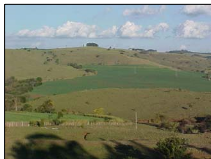
sub-unidade morfoescultural 2.4.6

A sub-unidade morfoescultural número 2.4.6, denominada Planalto de Apucarana, situada no Terceiro Planalto Paranaense, apresenta dissecação alta e ocupa uma área de 3.851,38 km², que corresponde a 23,34% desta Folha. A classe de declividade predominante está entre 6-12% em uma área de 1.373,12 km². Em relação ao relevo, apresenta um gradiente de 620 metros com altitudes variando entre 300 (mínima) e 920 (máxima) m. s. n. m. As formas predominantes são topos alongados, vertentes convexas e vales em “V”. A direção geral da morfologia é NW/SE, modelada em rochas da Formação Serra Geral.