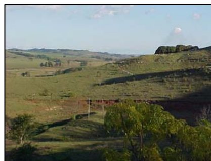
sub-unidade morfoescultural 2.4.6

A sub-unidade morfoescultural número 2.4.7, denominada Planalto de Londrina, situada no Terceiro Planalto Paranaense, apresenta dissecação média e ocupa uma área de 3.233,83 km², que corresponde a 19,60% desta Folha. A classe de declividade predominante é menor que 12% em uma área de 2.475,50 km². Em relação ao relevo apresenta um gradiente de 820 metros com altitudes variando entre 360 (mínima) e 1.180 (máxima) m. s. n. m. As formas predominantes são topos alongados, vertentes convexas e vales em “V”, modeladas em rochas da Formação Serra Geral.