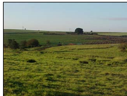
sub-unidade morfoescultural 2.4.9

A sub-unidade morfoescultural número 2.4.9, denominada Planalto do Maringá, situada no Terceiro Planalto Paranaense, apresenta dissecação baixa e ocupa uma área de 4.125,23 km², que corresponde a 25,00% desta Folha. A classe de declividade predominante é menor que 6% em uma área de 2.215,64 km². Em relação ao relevo, apresenta um gradiente de 400 metros com altitudes variando entre 340 (mínima) e 740 (máxima) m. s. n. m. As formas predominantes são topos alongados e aplainados, vertentes convexas e vales em “V”, modeladas em rochas da Formação Serra Geral.