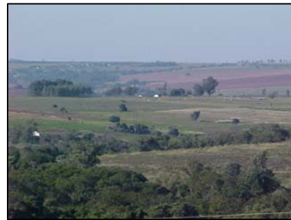
sub-unidade morfoescultural 2.4.12

A sub-unidade morfoescultural número 2.4.12, denominada Planalto de Umuarama, situada no Terceiro Planalto Paranaense, apresenta dissecação média e ocupa uma área de 695,67 km², que corresponde a 4,22% desta Folha. A classe de declividade predominante está entre 6-12% em uma área de 350,49 km². Em relação ao relevo, apresenta um gradiente de 320 metros com altitudes variando entre 280 (mínima) e 600 (máxima) m. s. n. m. As formas predominantes são topos alongados e aplainados, vertentes convexas e vales em “V”, modeladas em rochas da Formação Caiuá.