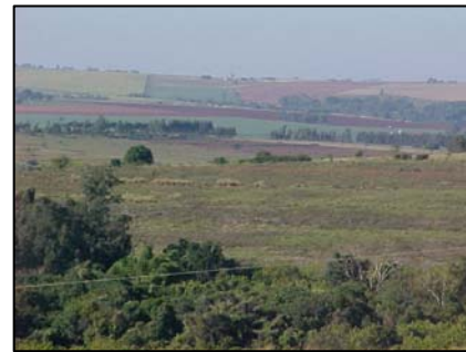
sub-unidade morfoescultural 2.4.12